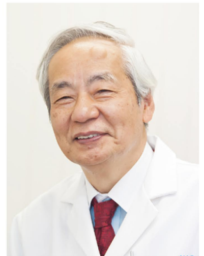
医療法人社団高千穂会 西台クリニック 理事長

病気は火事と同様、早期に小規模の段階で発見することが肝要で、その対応が容易になります。『早期がん診断』も可能となる訳で、その後の治療も侵襲(体の負担)が少ない治療方法で済むことになります。『用意の良い人間に幸運は微笑む』とは、フランスの科学者・パスツールの名言です。どなた様も定期的がん検診を継続受診されることにより、健康生活を全うされるよう願っております。